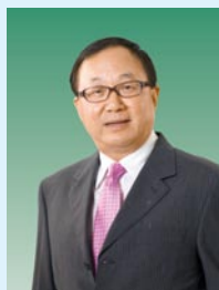
Michael Hui JP* Hon President Hong Kong Performing Artists Guild