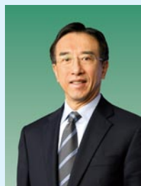
The Hon James Tien GBS JP Chairman Hong Kong Tourism Board

as at 31 October 2007 截至2007年10月31日在任的成員