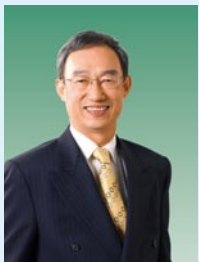
Lo Sui On JP Director & General Manager China Travel Service (HK) Ltd