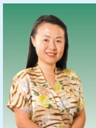
Au King-chi JP Commissioner for Tourism Commerce and Economic Development Bureau The Government of the Hong Kong SAR